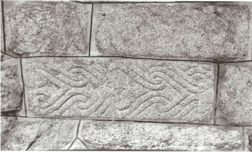
Relieve castreño de San Xiago (Amoeiro, Ourense)