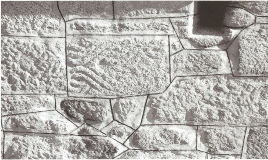
Relieve castreño de San Xiago (Amoeiro, Ourense)

relieve. Los primeros fragmentos que podrían formar parte del relieve de piedra de Formigueiros fueron recuperados del interior de la capilla de San Sebastián cerca del altar; se trata de una serie de círculos concéntricos formados por tres molduras y delimitados superiormente por una moldura en filete. El segundo fragmento apareció en el interior de una casa próxima a la capilla. La decoración de la pieza consiste en la sucesión de círculos resaltados rodeados por círculos concéntricos formados por tres molduras que no se unen en la parte superior, sino que salen hacia ambos lados del círculo para formar una punta de flecha y volver a iniciar un nuevo grupo de círculos concéntricos idénticos a los anteriores.