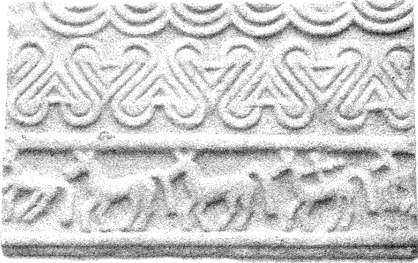
Relieve castreño de Formigueiros (Amoeiro, Ourense)

próximo a Formigueiros, y el Castro da Zarra; aunque no se conoce la procedencia original exacta de los fragmentos del relieve parece probable que fuesen traídos desde el castro de Monte do Castelo situado a menos de 100 m de la aldea de Formigueiros.